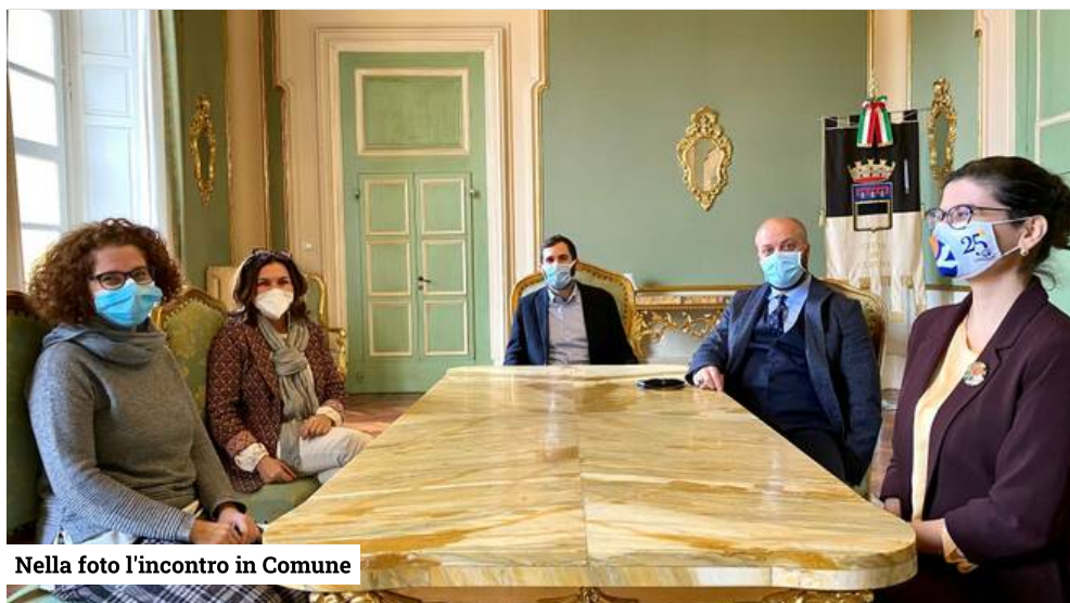
Nella foto l'incontro in Comune

Prosegue da parte del Comune di Cesena l'attività di sanificazione e igienizzazione dei plessi scolastici con particolare attenzione agli edifici in cui nel corso di queste settimane si sono registrati casi di contagio. A supporto della costante attività comunale arriva la donazione della cooperativa sociale "Il Mandorlo" che ha messo a disposizione del Comune 10 interventi alle scuole della città. Ciascun di questi comprende la sanificazione completa dell'intero Istituto (aule, laboratori e locali di servizio).