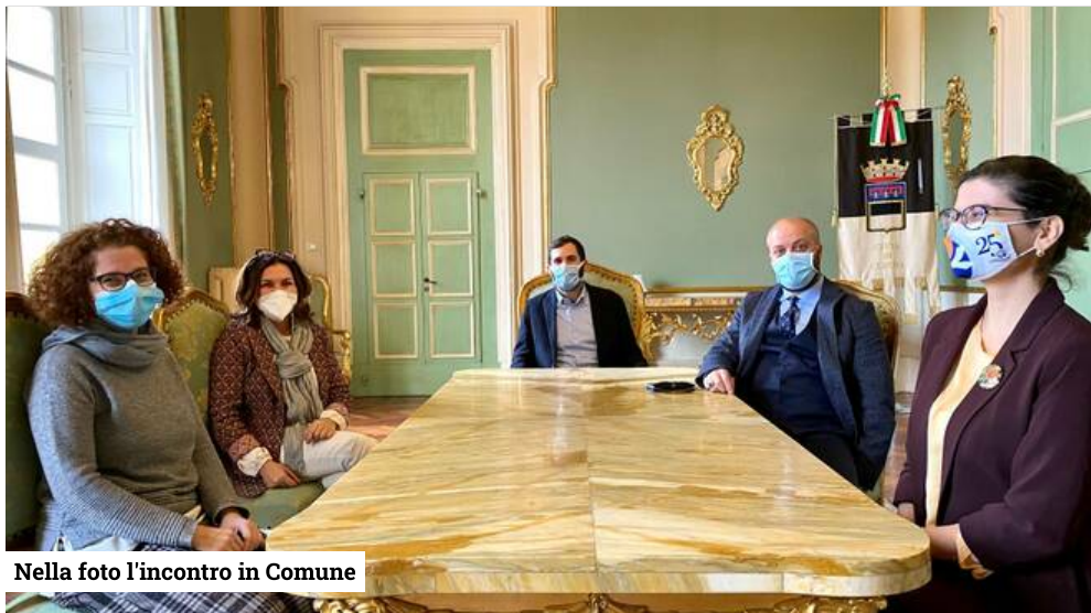
Nella foto l'incontro in Comune

Prosegue da parte del Comune di Cesena l'attività di sanificazione e igienizzazione dei plessi scolastici con particolare attenzione agli edifici in cui nel corso di queste settimane si sono registrati casi di contagio. A supporto della costante attività comunale arriva la donazione della cooperativa sociale "Il Mandorlo" che ha messo a disposizione del Comune 10 interventi alle scuole della città. Ciascun di questi comprende la sanificazione completa dell'intero Istituto (aule, laboratori e locali di servizio).